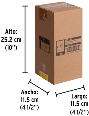
Alto: 25.2 cm (10")