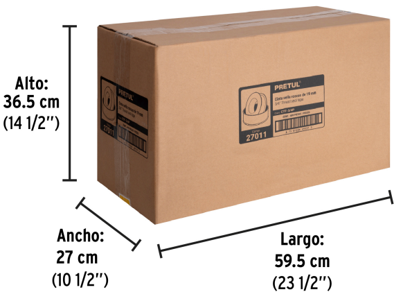
Alto: 36.5 cm (14 1/2")