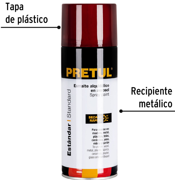
Tapa de plástico