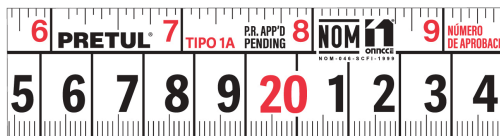
Números grandes de fácil lectura

Cinta blanca cubierta de laca que evita rayaduras y desgaste