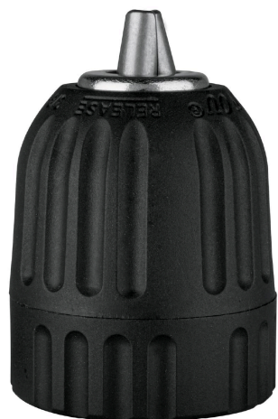
Cuerpo de nylon