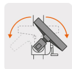
Trabajos a 45° y 135°