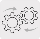
2 velocidades mecánicas