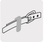
Clip de cinturón