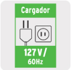
Cargador 127 V / 60Hz