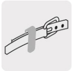
Clip de cinturón