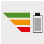
Baterías con indicador de nivel de carga