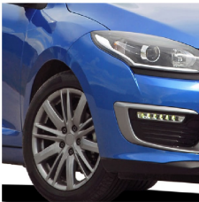
Llantas de automóviles