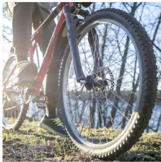
Llantas de bicicletas