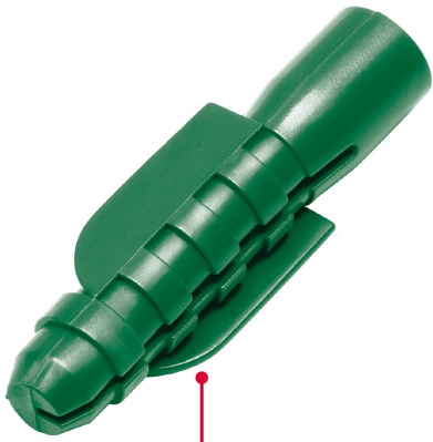
Cinturones de resistencia y anclas retráctiles de fijación