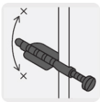
Anclas que evitan el giro