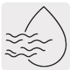
Aplicación húmedo y seco