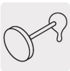
Presentación en lata, incluye aplicador