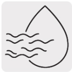
Aplicación húmedo y seco