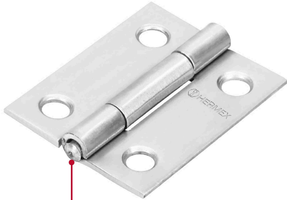
Perno remachado con cabeza media bola