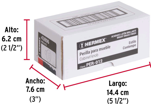
Alto: 6.2 cm (2 1/2")