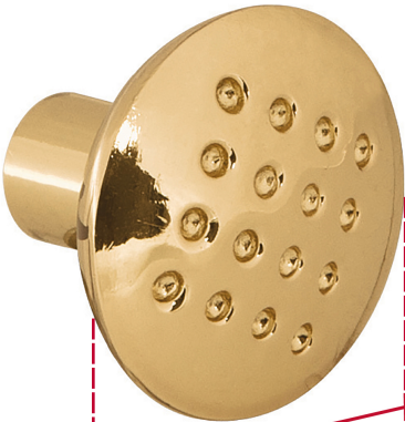
Diámetro 31 mm