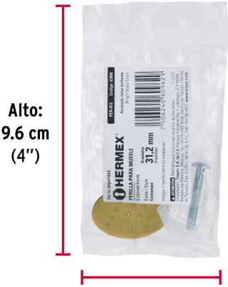
Alto: 9.6 cm (4")