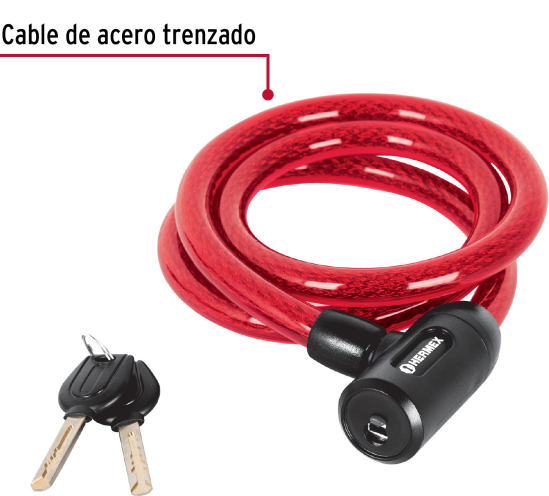
Cable de acero trenzado