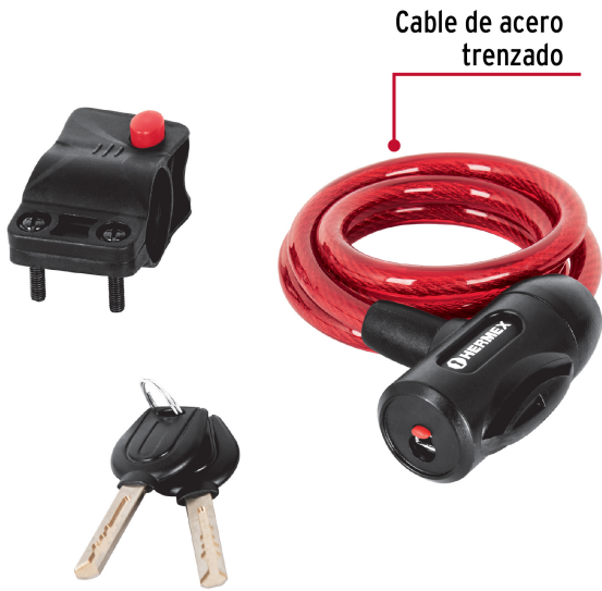
Cable de acero trenzado