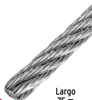
Diámetro 1/4" (6.5 mm)