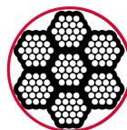
7 x 19 Hilos