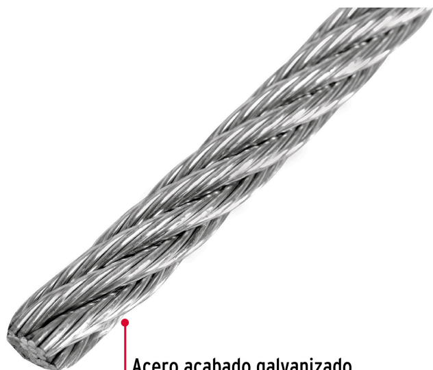
Acero acabado galvanizado