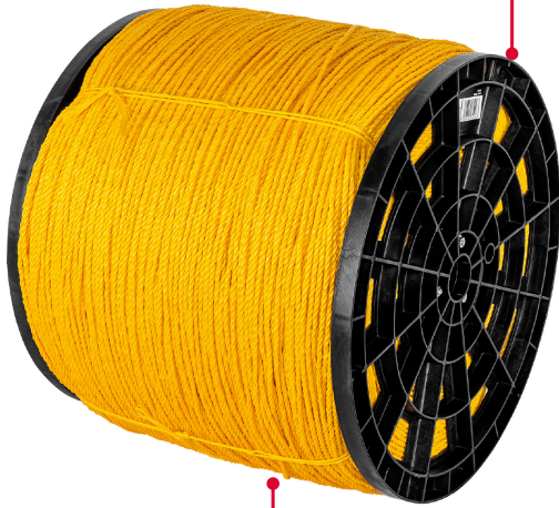
Fabricada en polipropileno