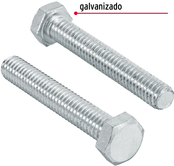
Acero con recubrimiento galvanizado