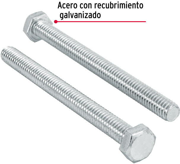
Acero con recubrimiento galvanizado