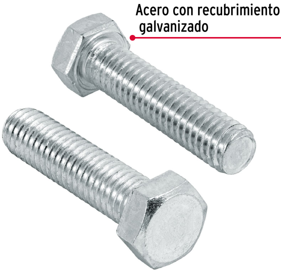
Acero con recubrimiento galvanizado