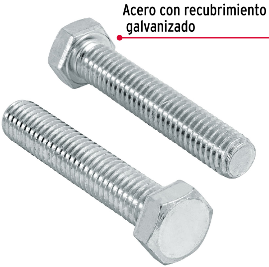
Acero con recubrimiento galvanizado