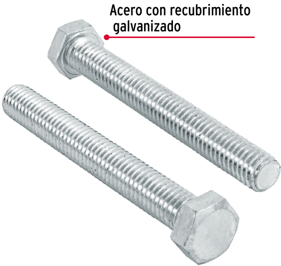
Acero con recubrimiento galvanizado