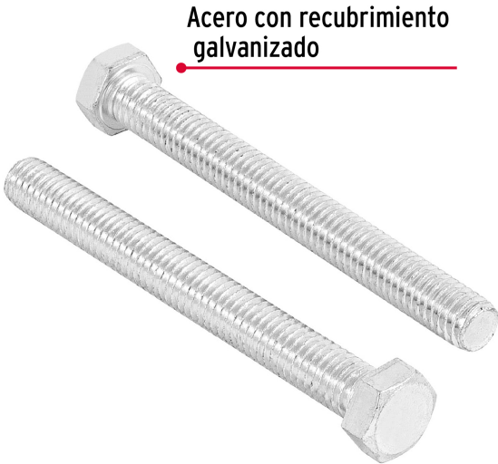
Acero con recubrimiento galvanizado