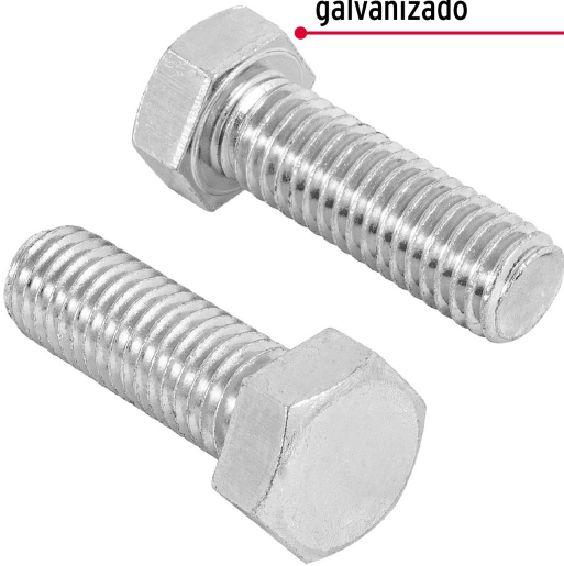
Acero con recubrimiento galvanizado