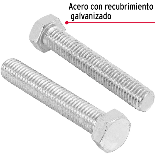
Acero con recubrimiento galvanizado