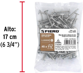
Alto: 17 cm (6 3/4")