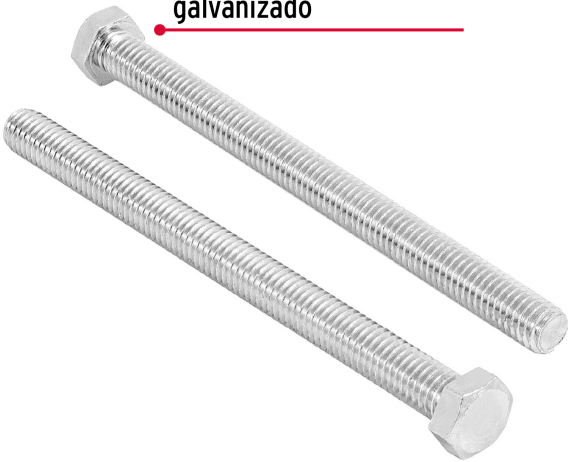
Acero con recubrimiento galvanizado