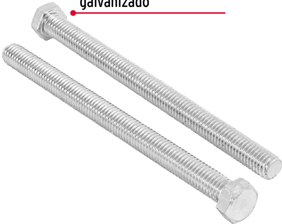
Acero con recubrimiento galvanizado