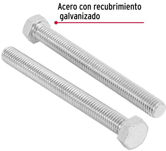
Acero con recubrimiento galvanizado