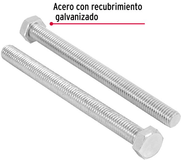
Acero con recubrimiento galvanizado