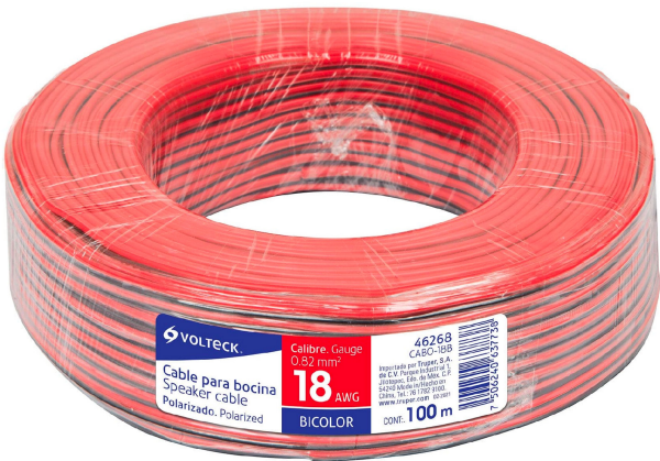
Rollo de 100 m