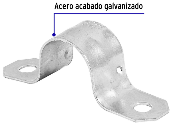
Acero acabado galvanizado