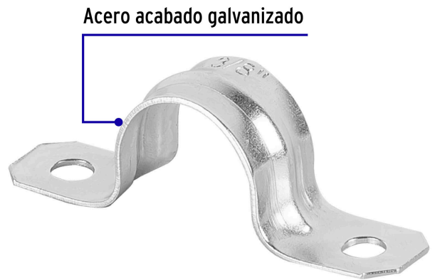
Acero acabado galvanizado