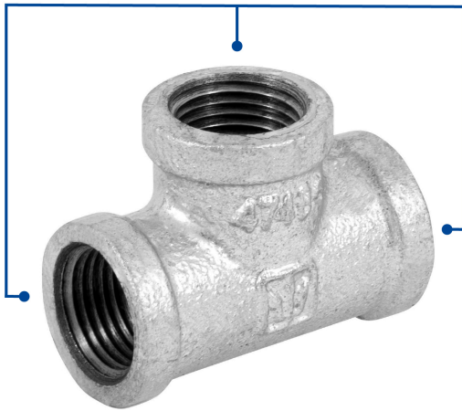
Conexiones roscables de 1/2" (13 mm)