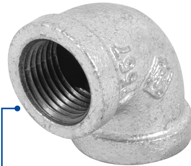
Conexiones roscables de 1/2" (13 mm)