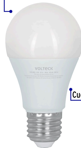
Pantalla de policarbonato