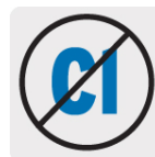
Reduce olor, color y sabor a cloro