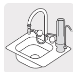
Purificador sobre tarja