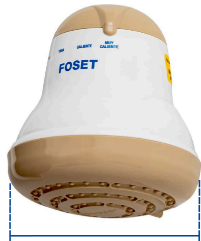
Diámetro 14.5 cm