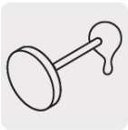
Presentación en lata, incluye aplicador