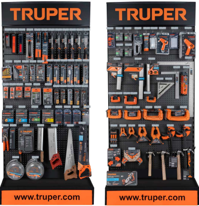
Planograma de carpintería