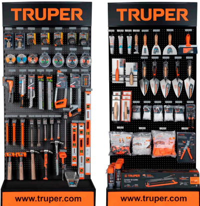
Planograma de construcción