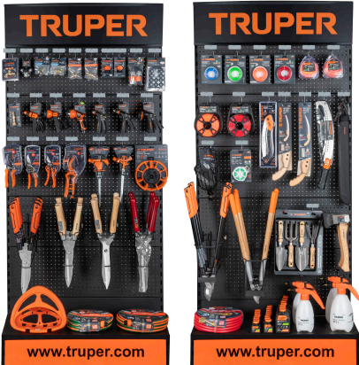
Planograma de jardinería