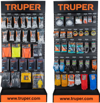
Planograma de seguridad industrial