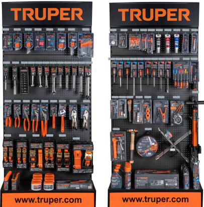
Planograma de mecánica