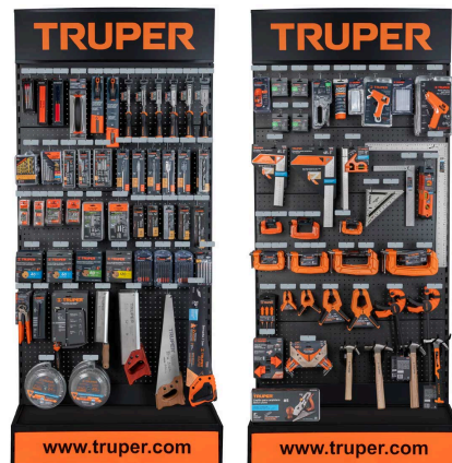
Planograma de carpintería