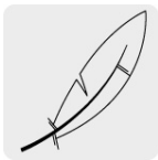
Pluma y plumón de ganso