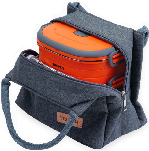
Incluye bolsa térmica