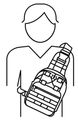
Bolsa de pecho