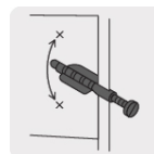
Anclas que evitan el giro