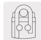
Seguro de doble balín