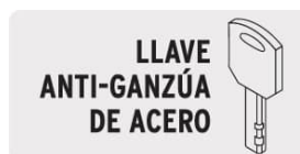
LLAVE ANTI-GANZÚA DE ACERO