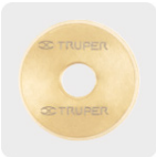
Cuchillas con recubrimiento de titanio