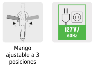
Mango ajustable a 3 posiciones