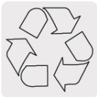
El cobre es un material reciclable